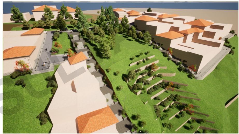
01 VISTA 02 PROPUESTA TRATAMIENTO DE ZONA DE PROTECCIÓN CON REGLAMENTACIÓN ESPECIAL